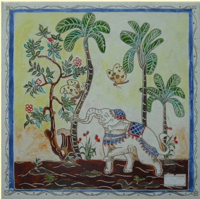
ชื่อ ๑๙๖ รูปช้างป่า ภาพพระตำบกระเบื้องแผ่น