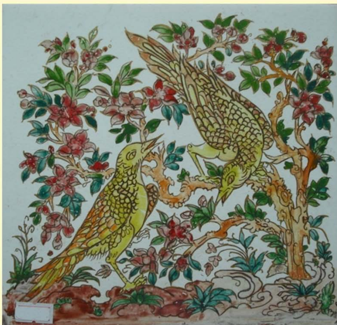
ชื่อ ๑๙๖ รูปนก-ไม้คู้ ภาพพระตำบกระเบื้องแผ่น