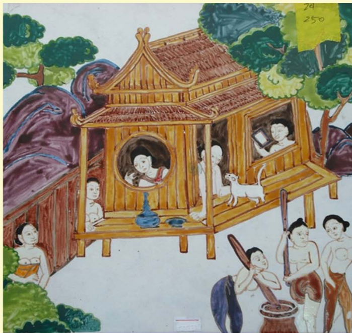
ชื่อ ๑๙๖ วิถีชีวิตไทยวัดบางแคช้อย ภาพพระตำบกระเบื้องแผ่น